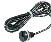
C-MIC480 Einbau- Elektretmikrofon