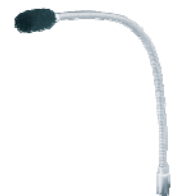
C-MIC 473 Schwanenhalsmikrofon